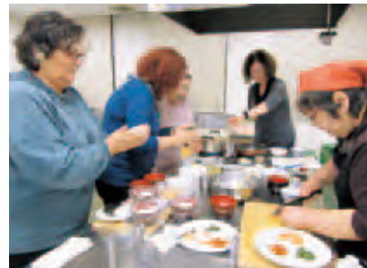
イスラエルの旅行者とおにぎり作り

はじめに「長生き日本、長生き長野県の特徴」と題した講話を行ったあと、グループに分かれてシルバーカフェのメンバーとイスラエルの方と一緒に、「おにぎり」「きのこ汁」「凍み豆腐粉の炒り煮」の3品を作りました。