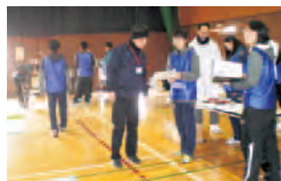
学生が測定結果を熱心に解説

家庭に案内ちらしを配布してあったため、この体力測定だけを目標で来場する方も何人かいました。参加された方の中には、初めて体験する脚筋力測定機で脚力が平均より衰えている数値を見て驚いている方もいました。体験者からは「これから筋トレをがんばるのでぜひ来年も実施してほしい」等のご要望を、参加した学生からは「地域のお役に立てたことに満足した」「少しでも健康に興味を持ってもらえてうれしい」「現場体験で一層学びが深まった」等の感想が寄せられました。