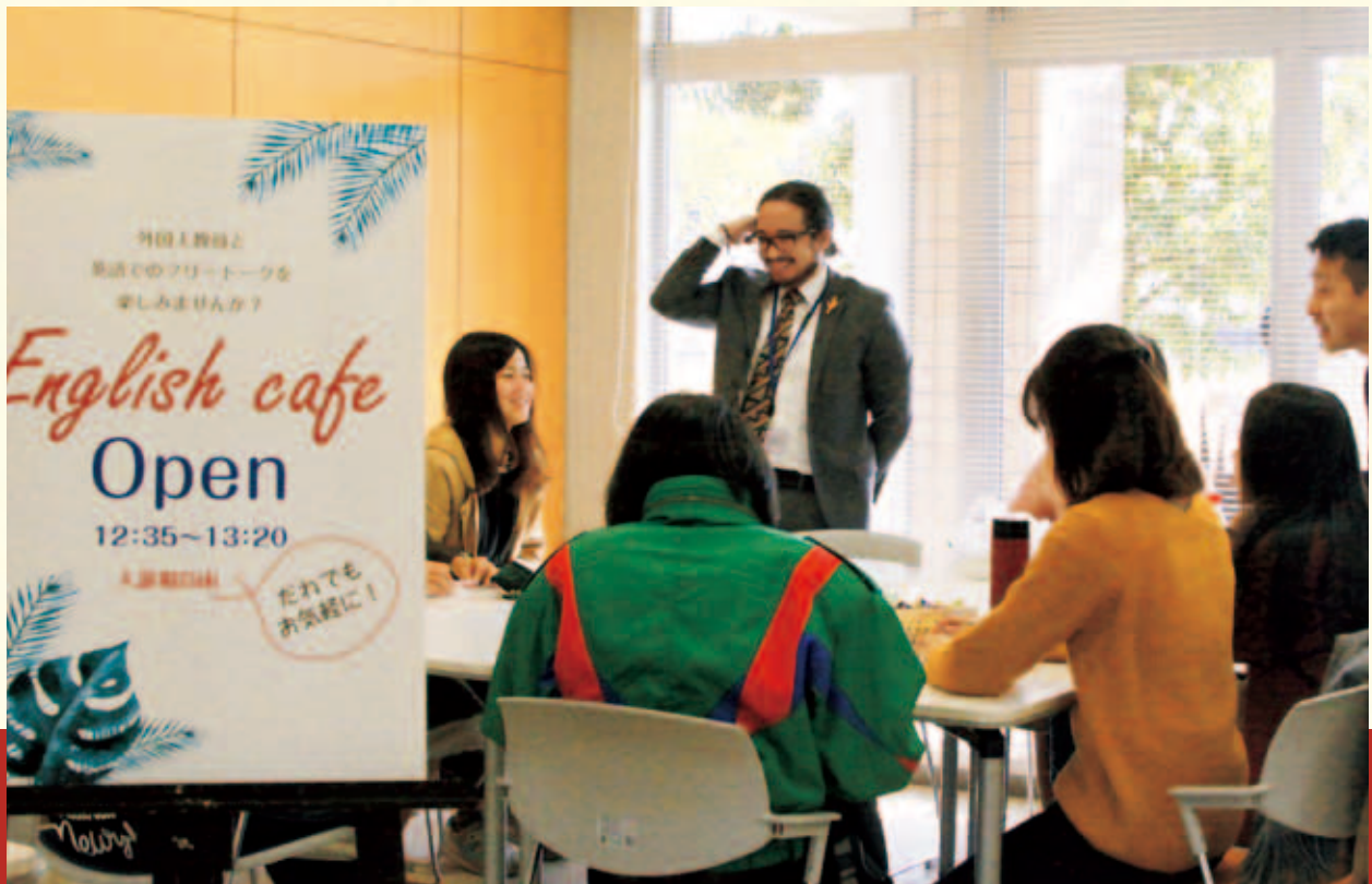
English Caféはじまる (詳しくはP.6をご覧ください。)