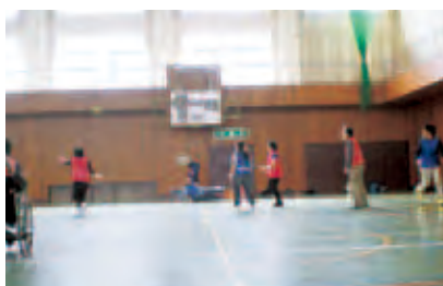
2チームで対抗ゲーム

朝日村と山形村の精神障がい者施設に通所する方々の、運動不足になりがちな日常生活に少しでも運動を取り入れたいと両村から依頼があり、10月4日に朝日村体育館でレクリエーションを実施しました。11人の参加者が青チームと赤チームに分かれ、ぞうきんしほり、ワンバウンドパスやディスクッターで競争しました。競争となると皆さん夢中になって取り組みます。この日は車椅子の方も参加さ