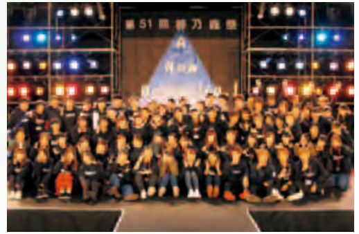
大学祭終了後、集合写真に収まる実行委員のメンバー

学生が、かくも遅くも変化し成長してゆけるのは、ひとえに、松本大学ならびに松本大学松商短期大学部の教育を応援し、支えてくださる地域住民の方々のあたたかいお力添えがあったからこそと感謝しております。ありがとうございました。