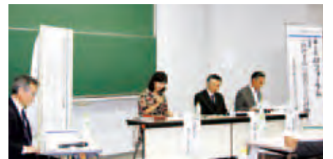
パネル・ディスカッション

松本大学松商短期大学部では、平成28年度に採択された「文部科学省大学教育再生加速プログラム(AP):高大接続