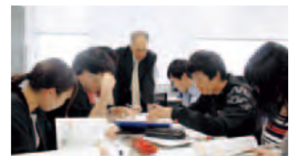
教職センター学習室にて

今後も、幅広い分野（小学校・中学校・高等学校の教諭、養護教諭、栄養教諭）の教員採用試験突破に向けて、支援体制、内容を充実させ、地域社会の人々との協働能力を備えた教員を養成することを目指します。