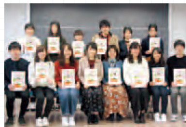
完成したレシピ集を手に集合写真

研究室が病院と協働で開催している糖尿病青空教室の昼食会は8年目を迎え、これまでの活動の集大成として、今年は「時短・簡単・節約レシピ」集を完成させて配布しました。