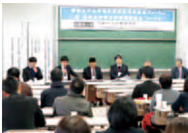
活発な議論が展開したシンポジウム

長野県内外から保育士、小中高等学校の先生方、教育委員会関係者、総合教育センターの関係者、そして昭和女子大学と松本大学の教員と学生など、75名の方にご参加いただき、盛況のうちに閉会となりました。