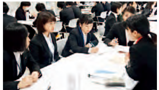
就職対策セミナーで、先輩学生から指導を受ける3年生

による後輩への支援やサポートをこれまで以上に取り入れ、これが実践的な指導に繋がりが大きな成果を得ています。また、指導者となる社会に出る直前の4年生は、社会人になるための責任感と内定先に対する自信と尊厳を持ち、巣立っていきます。こうした「繋がりが」本学の伝統や文化となり、今後の就職活動に活かされ、常に地域に愛され続ける大学として歴史を刻んでいければと思います。