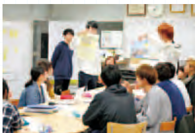
定例会を重ねて、準備に励む実行委員会

「あるぷすタウン」は、松本大学に1年のうち2日間だけ現れる「子どもたちがつくる仮想の街」です。学生と社会人による実行委員会で企画し、多くの企業の協力により職業体験の場が設けられ、高校生や大学生