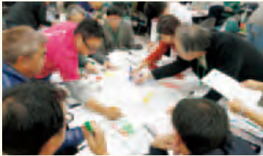
災害図上訓練(DIG)の様子

ワークショップでは「災害図上訓練DIG(ディグ)」を通して、被害想定、対応行動等のケーススタディを体験し、県内外の社会人受講生とともに学んだ学生たちからは、「社会人の方から貴重な話を聞くよい機会となり勉強になった」との声もありました。