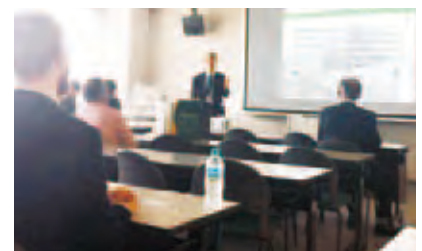
国際色豊かな国際記憶円卓会議

10月15日、本学の大学祭に国際色とアカデミックな彩りを加えるため「国際記憶円卓会議」と題した国際シンポジウムを企画しました。2年前から、複数の目撃者間の記憶の同調に関する国際比較研究を世界11カ国の認知心理学者と共同で行っており、トルコ・ポーランド・インド・ニュージーランドの研究者を招く機会が得られたこともきっかけの一つです。本学の学生には国際学会の雰囲気を感じてもらい、外国からの参加者には松本大学の大学祭を楽しんでいただくことができ、双方に有意義な時間となりました。