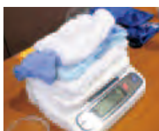
ぞうきんしほりゲームで、どれだけ絞れたかタオルを計測

れ、楽しい軽い動きで運動不足を解消しました。参加者からは「時々やりたい」「いい汗かいた」との声を頂きました。