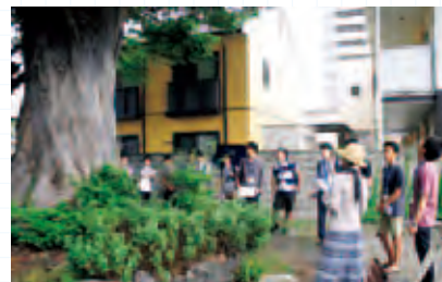
保存樹の榎の歴史を学ぶフィールドワーク

松本市渚地区には、市指定の保存樹である十数本の榎があります。この榎は、長年にわたって河川に囲まれた地域の地盤の安定化や洪水被害の防止に役立ってきましたが、周囲の宅地化に伴い、落葉が近隣住宅の樋を詰まらせる事からトラブルの種になっていました。そうしたことから住民の依頼を受けて、本プロジェクトが始動したのです。