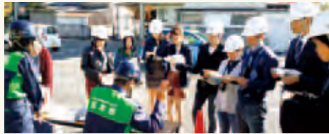
新村地区の方と。無線機を届ける場所を入念に確認

松本大学の第1体育館と5号館は新村地区の指定避難場所になっています。従って、災害時には本学学生のみならず地区住民の方々も本学に避難し集まることとなります。ここ数年、本学の災害時避難訓練は地元新村