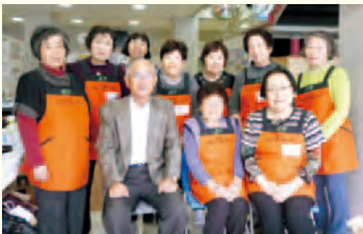
マーブルの会のみなさんと学長とで記念撮影