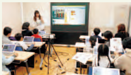
プログラミングソフト「Scratch」を使ってゲームを制作

「実際に情報を教える」という貴重な機会を学生に提供して下さった、安曇野市教育委員会に改めて感謝いたします。