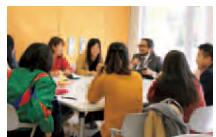
外国人教員と和やかに談笑

英語での交流を楽しみたい学生、海外文化に興味のある学生、留学に関心のある学生などが、予約不要で気軽に参加できます。2017年度後期は4回程度実施する予定で、多くの学生の参加を期待しています。