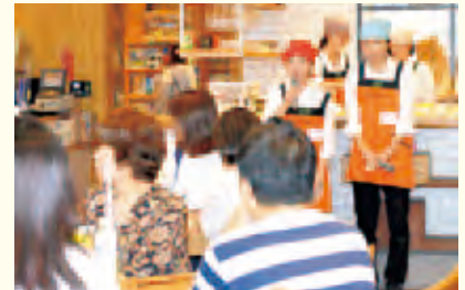
学生が銀座NAGANOでプレゼン