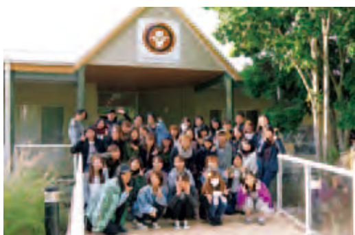
アボリジニの文化を体験するフィールドワークに参加

オーストラリア人の温かな人柄にも助けられ、多くの経験を重ねあつという間に研修の終了がやってきました。帰国の際には、別れに涙したり、日本に帰りたくなったりするほどオーストラリアに慣れていました。これらの貴重な経験は、今後学生が国際的に行動していく際にも、また日常生活にも大変役に立つものとなるでしょう。