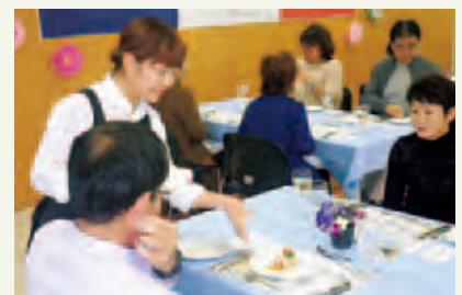
接客指導の後、料理を提供する学生