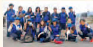
手荷物渡し係の学生達と

個余りもの荷物を担当します。ランナーがゴールし始めた10時半頃に荷物の受け渡しが始まってから最終午後3時前まで、「〇〇番」と呼ぶ人、探す人、渡す人とフル稼働でテキパキと動いていました。終わってみれば一瞬でしたが「いろいろな大会に参加されているんですね」「お疲れ様でした」などと声をかけ、様々な出会いがありました。学生達は、完走した人、途中で断念した人を見送りながらそれぞれの思いをはせていました。