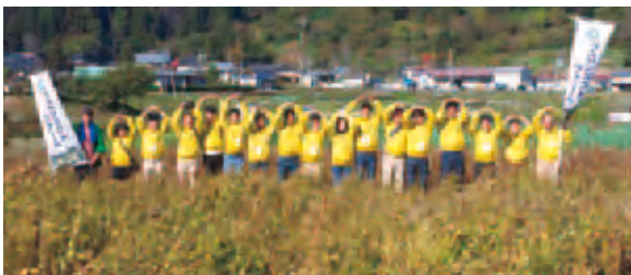
種まき後、無事に実った西山大豆の畑にて

松本大学と長野市道の駅「中条(なかじょう)」及び長野国道事務所は、2015年度より長野県初の産学官連携事業を開始しました。連携企画の実施にあたり、本学と道の駅「中条」指定管理者アクティオ株式会社は事業連携・推進に関する協定を締結しております。道の駅「中条」を拠点とした地域づくりと地域活性化を図ることにより、地域の発展と学生教