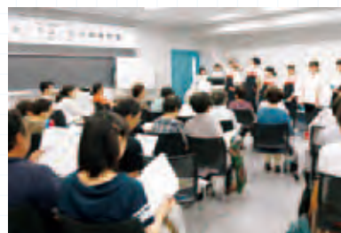
健康や栄養についてわかりやすく講義

健康栄養学科3年生の栄養教育実習の一環で、地域の方々を対象に実施した「おいでよ♪松大健康教室」で地域貢献大賞にエントリーしました。健康栄養学科1期生のときから