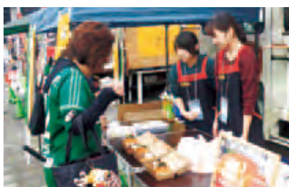
サンドイッチ「ガンズくん」とロアックくん」を販売

10月7日、松本山雅FCのアルウィンでのホーム戦で、学生が提案した「スタめし」が販売されました。8期目となる今年は健康栄養学科1,2年生10人が取り組み、5品が商品化されました。