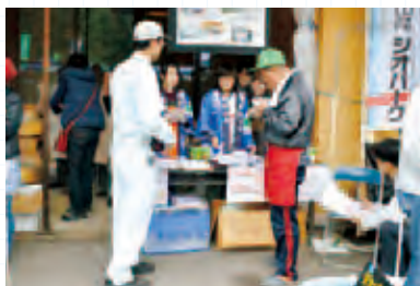
栄村収穫祭での出店・交流

ええじゃん栄村は、2011年3月12日に発生した長野県北部地震で被災した栄村を応援しようと活動を行ってきました。栄村のことを多くの人達に知ってもらおうと、地域の山菜(イタドリ)のレシピ集