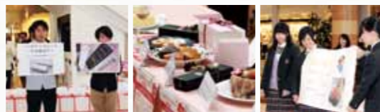
昨年のバレンタインスイーツ 商品発表会の様子

昨年度からは、より多くの若者のアイデアを発信するために、松本大学の大学生も参加して、松本大学が主催し、株式会社井上と長野県商業教育研究会の共催によって開催するものです。