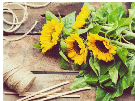
7 月(文月) 向暑 盛夏 酷暑

観測史上初の 6 月中の梅雨明けでした。暑い日が例年より長く続くのでしょうか？熱中症に気を付け、充実した夏休みを過ごしましょう！