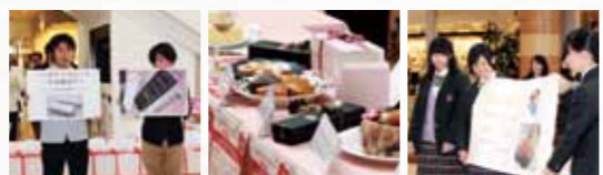
昨年のバレンタインスイーツ 商品発表会の様子

昨年度からは、より多くの若者のアイデアを発信するために、松本大学の大学生も参加して、松本大学が主催し、株式会社井上と長野県商業教育研究会の共催によって開催するものです。