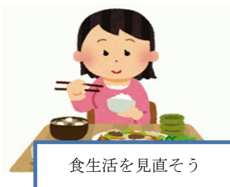
食生活を見直そう