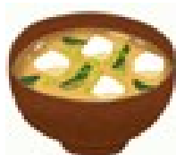
家庭の味付け 濃くないですか?