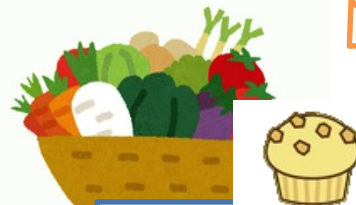
野菜を美味しく食べよう