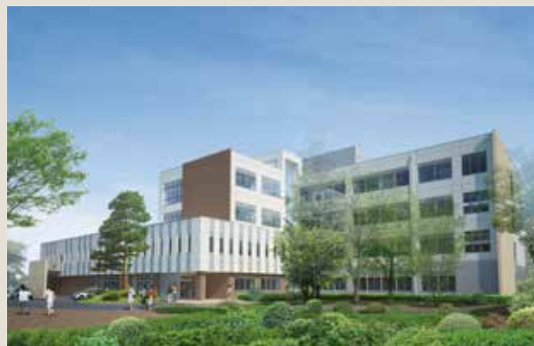
教育学部棟(8号館)完成予想図