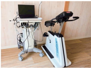
呼吸ガス分析装置

運動時の酸素摂取量や二酸化炭素の排出量を計測し、個別に運動強度の設定を行います。