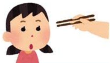
お箸を正しく持つ