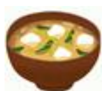
家庭の味付け 濃くないですか?