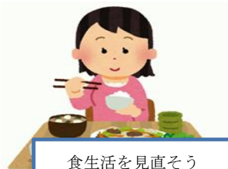
食生活を見直そう