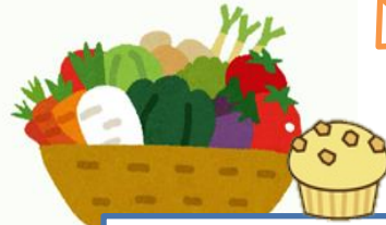
野菜を美味しく食べよう